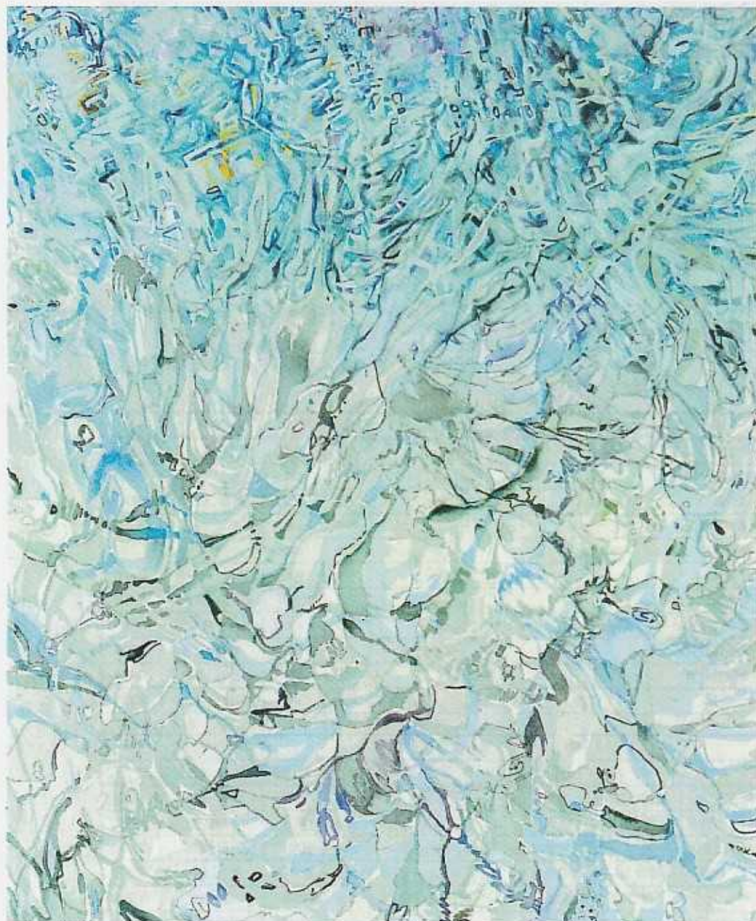
(第15回記念奄美を描く美術展大賞 山口明日香(宇枝村)「阿室海景Ⅲ」F15 水彩・グワッシュ)